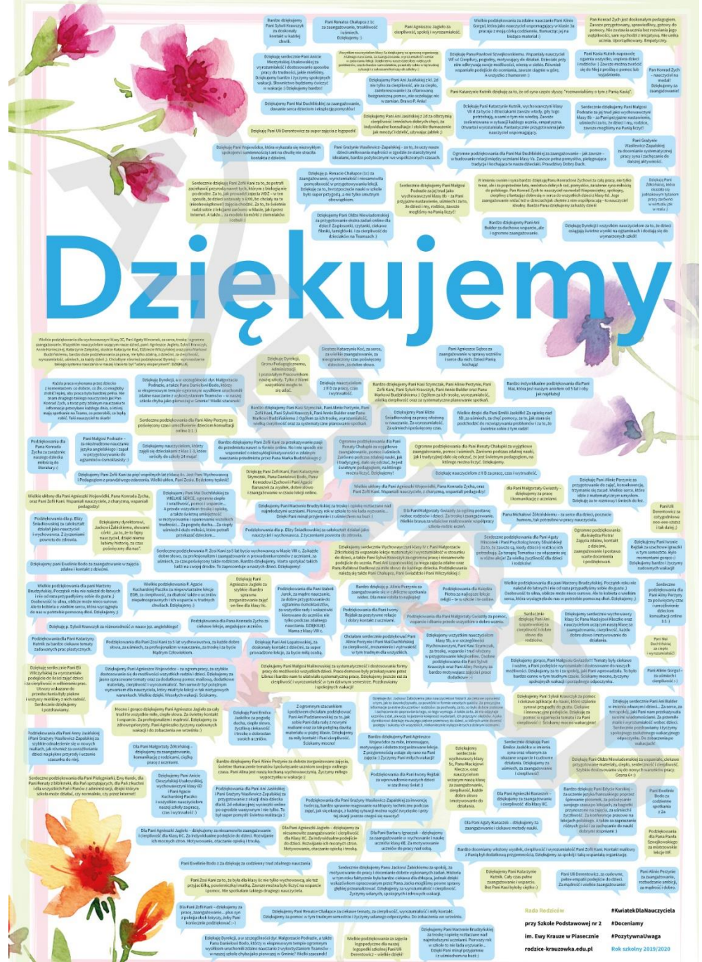
Podziękowania zebrane przez internet od rodziców dzieci uczących się do nauki w roku szkolnym 2019/2020

Czerwiec 2020 – zorganizowaliśmy akcję „Kwiatek dla nauczyciela”. W ramach akcji powstał plakat w formacie A2 z podziękowaniami od rodziców dla nauczycieli oraz wszystkich osób zaangażowanych w edukację naszych dzieci. Dziękujemy wszystkim rodzicom, którzy włączyli się do napisania podziękowań 😊 Wydrukowany plakat będzie wisiał na drzwiach szkoły od dnia zakończenia roku. Dyrekcja otrzyma od nas oprawiony plakat w antyramie. Liczymy na to, że będzie miłą niespodzianką!